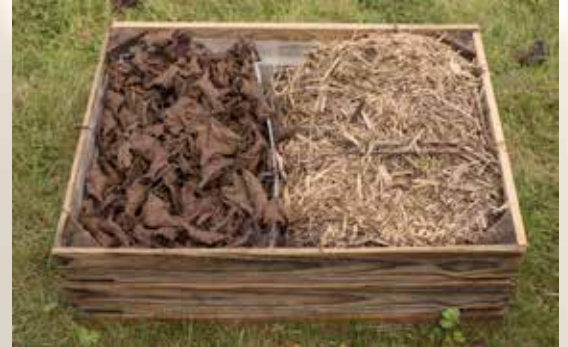
Les feuilles sèches et le broyat de vos tailles.