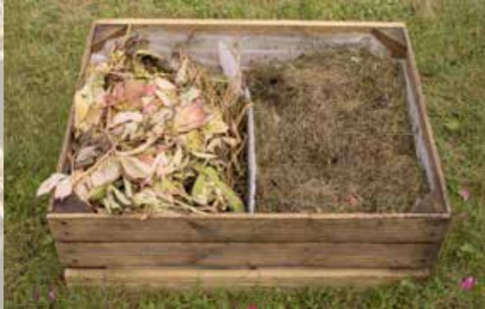
Les fanes de votre jardin et la tonte de pelouse fraîche ou sèche.