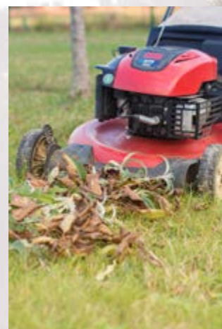
Broyage à la tondeuse

Les déchets broyés récupérés dans le panier pourront être mis dans le composteur ou servir de paillis.