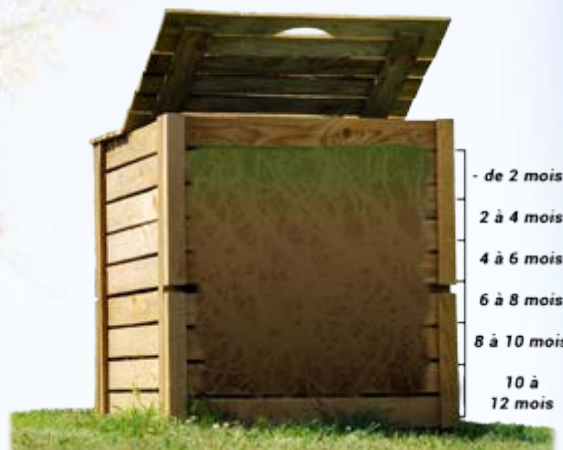
Maturation du compost

Contact : l.da-silva@sietom77.com - 01 64 07 37 80