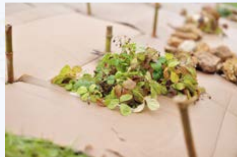
Paillage des fraisiers avec du carton brun

Vous pouvez également semer densément un engrais vert dès qu'une culture se termine. Il occupera de manière bénéfique la terre et servira de couvre-sol.