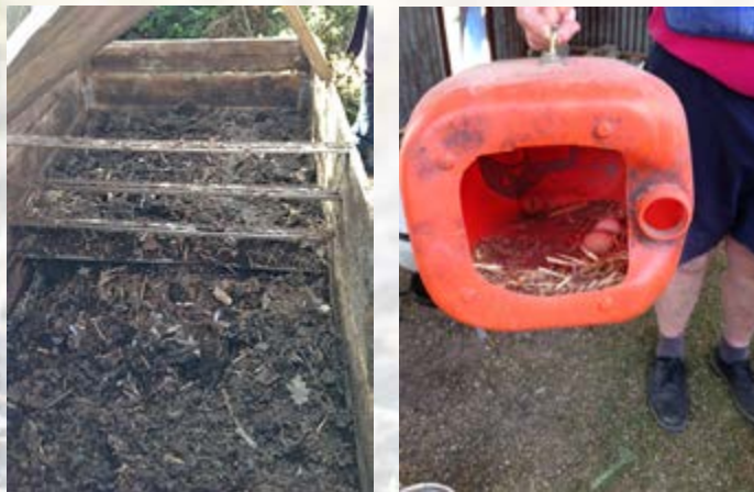
Culture sur couches chaudes et pondoir de récupération.

Il nous a ensuite présenté ses animaux de la basse-cour et leurs bienfaits pour le jardin.